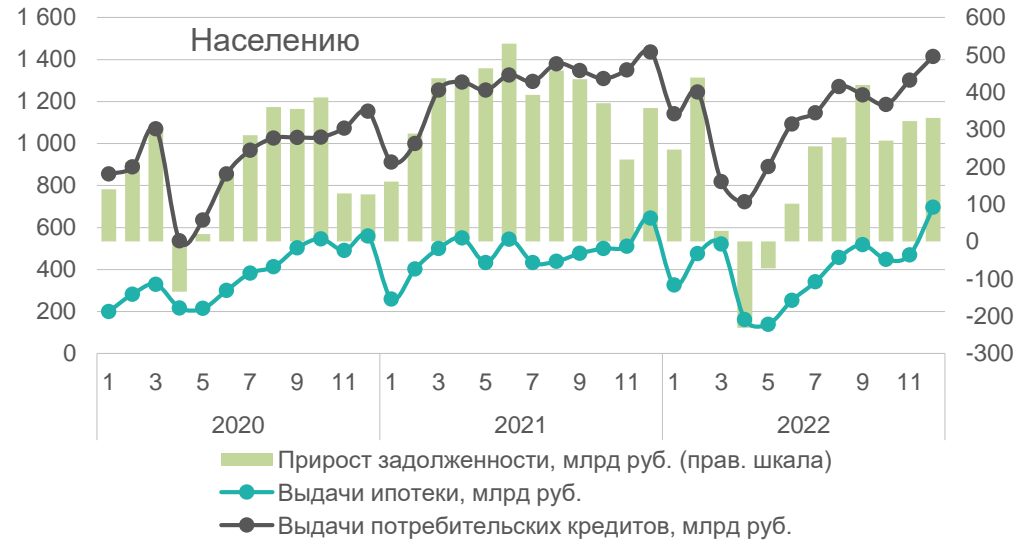
Предоставление кредитов, млрд рублей