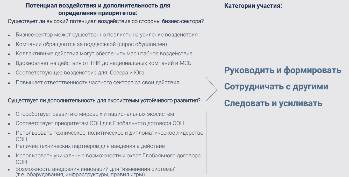
РИСУНОК 5: ОЦЕНКА ПОТЕНЦИАЛА ВОЗДЕЙСТВИЯ ГЛОБАЛЬНОГО ДОГОВОРА ООН И ДОПОЛНИТЕЛЬНЫХ ВОЗМОЖНОСТЕЙ

В каждой из этих категорий мы рассмотрели 6 различных элементов, чтобы проверить наше мышление, обоснование и оценку.