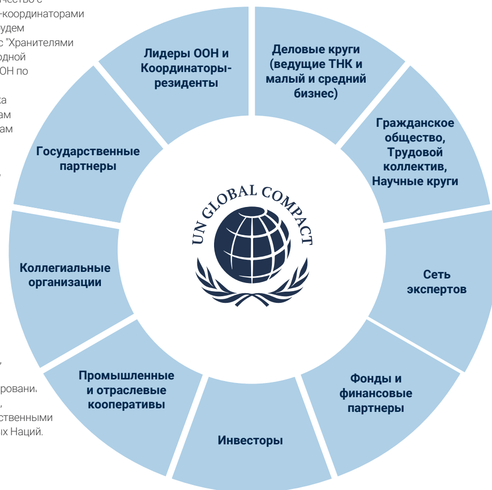
РИСУНОК 2: ОСНОВНЫЕ ЗАИНТЕРЕСОВАННЫЕ СТОРОНЫ ГЛОБАЛЬНОГО ДОГОВОРА ООН

Среди наших участников в основном три типа бизнеса: многонациональные корпорации (ТНК), ведущие национальные компании и малый и средний бизнес (МСБ). Каждый из этих участников является ключевым участником Глобального договора ООН, и нам требуется солидное представительство и участие каждого типа, чтобы обеспечить глобальное, коллективное и масштабное влияние, к которому мы стремимся.