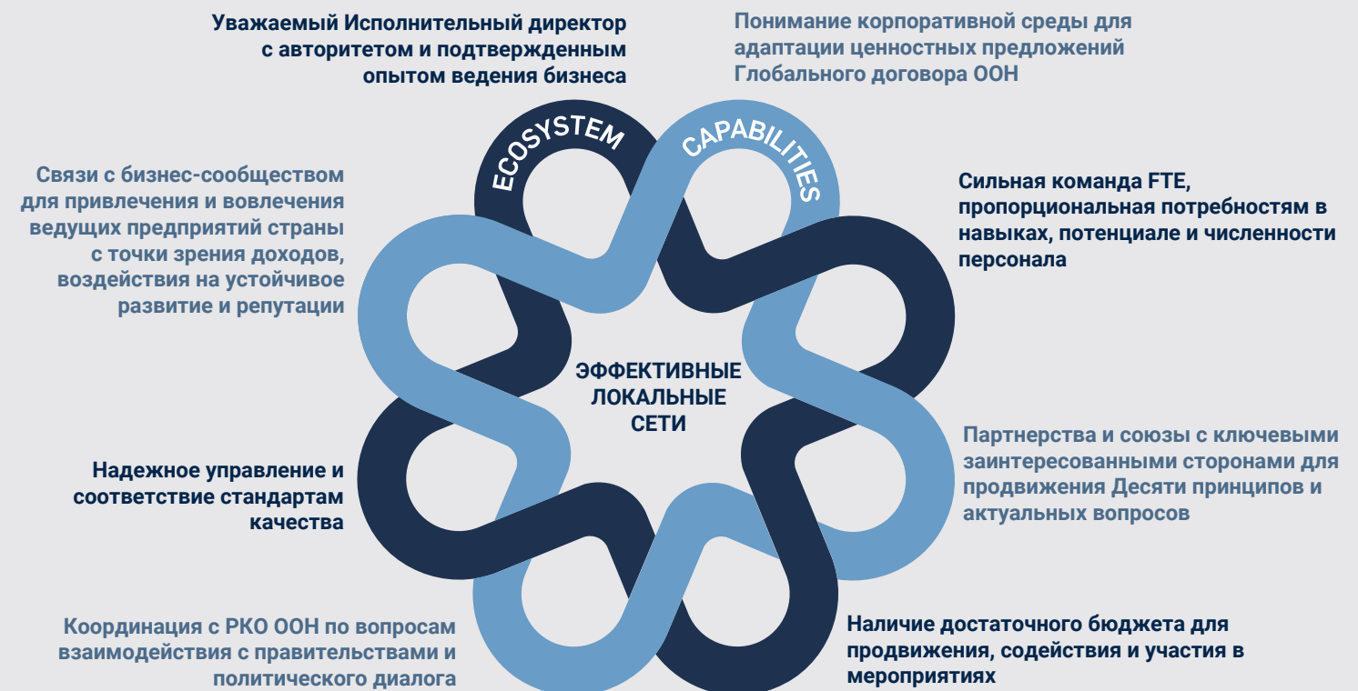
РИСУНОК 8: УСПЕШНЫЕ ЛОКАЛЬНЫЕ СЕТИ - ВОСЕМЬ СОСТАВЛЯЮЩИХ

Расширение присутствия Глобального договора ООН увеличит потребность в дальнейшей организационной поддержке со стороны Офиса Глобального договора ООН. Для создания новых Региональных и Локальных сетей, обновленная и региональная операционная модель будет способствовать эффективной доставке специализированного контента участникам Глобального договора. Глобальный договор имеет три существующих Региональных центра в Африке, на Ближнем Востоке и в Латинской Америке. В рамках этой стратегии мы создадим еще два Региональных центра, чтобы обеспечить полную и эффективную поддержку нашим Локальным сетям.